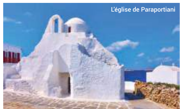
L'église de Paraportiani