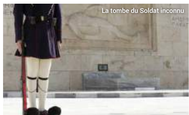
La tombe du Soldat inconnu