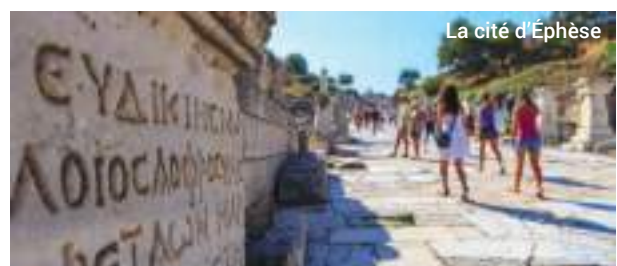
La cité d'Éphèse

Éphèse est l'un des plus vastes, et fascinants musées archéologiques de plein air au monde. Vous n'êtes pas près d'oublier cette excursion.