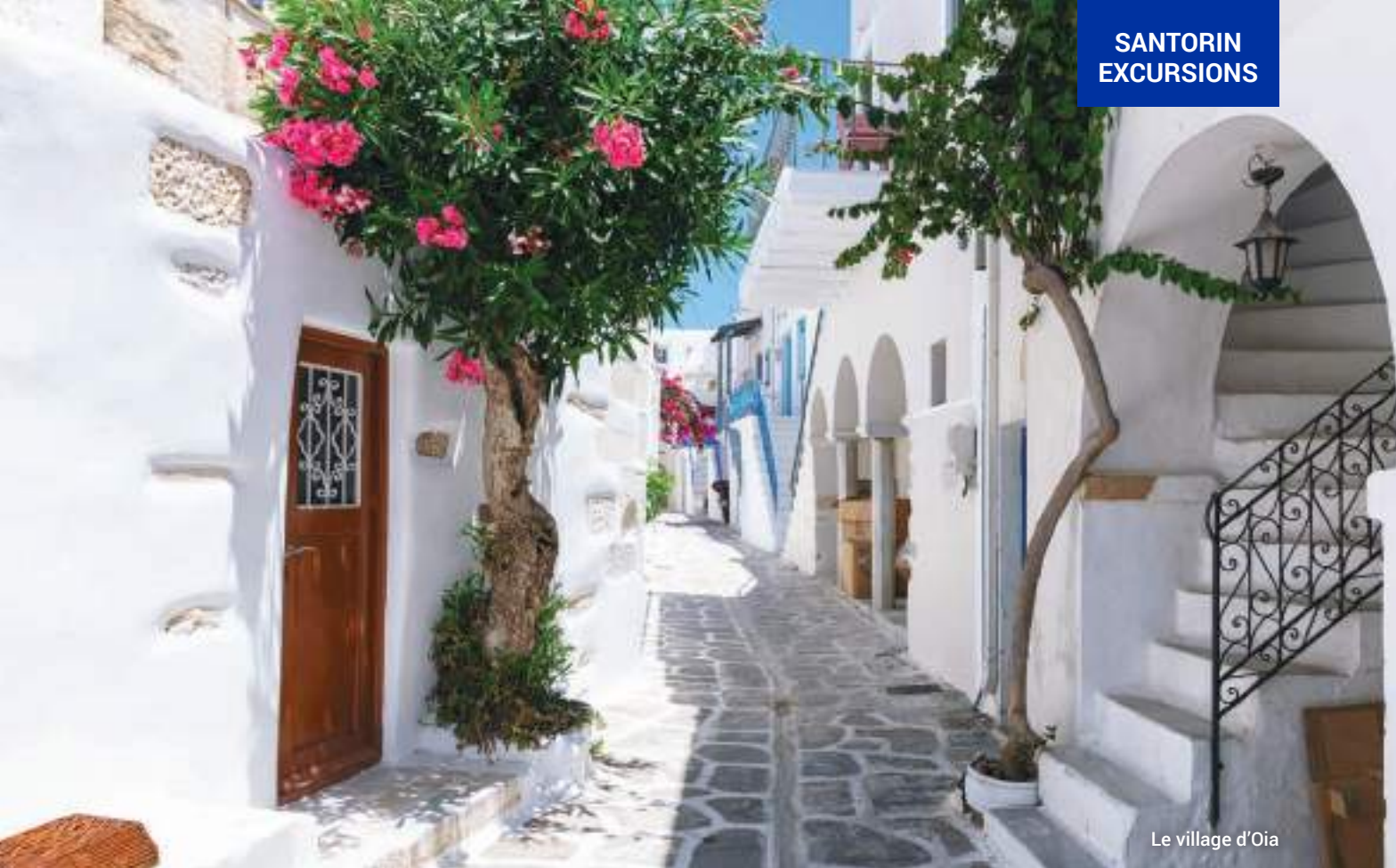
Le village d'Oia