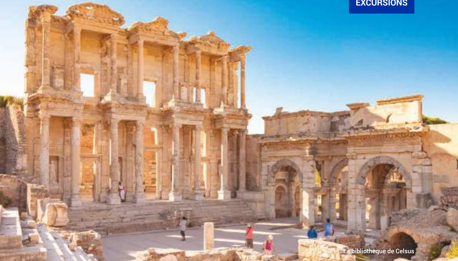
La bibliothèque de Celsus