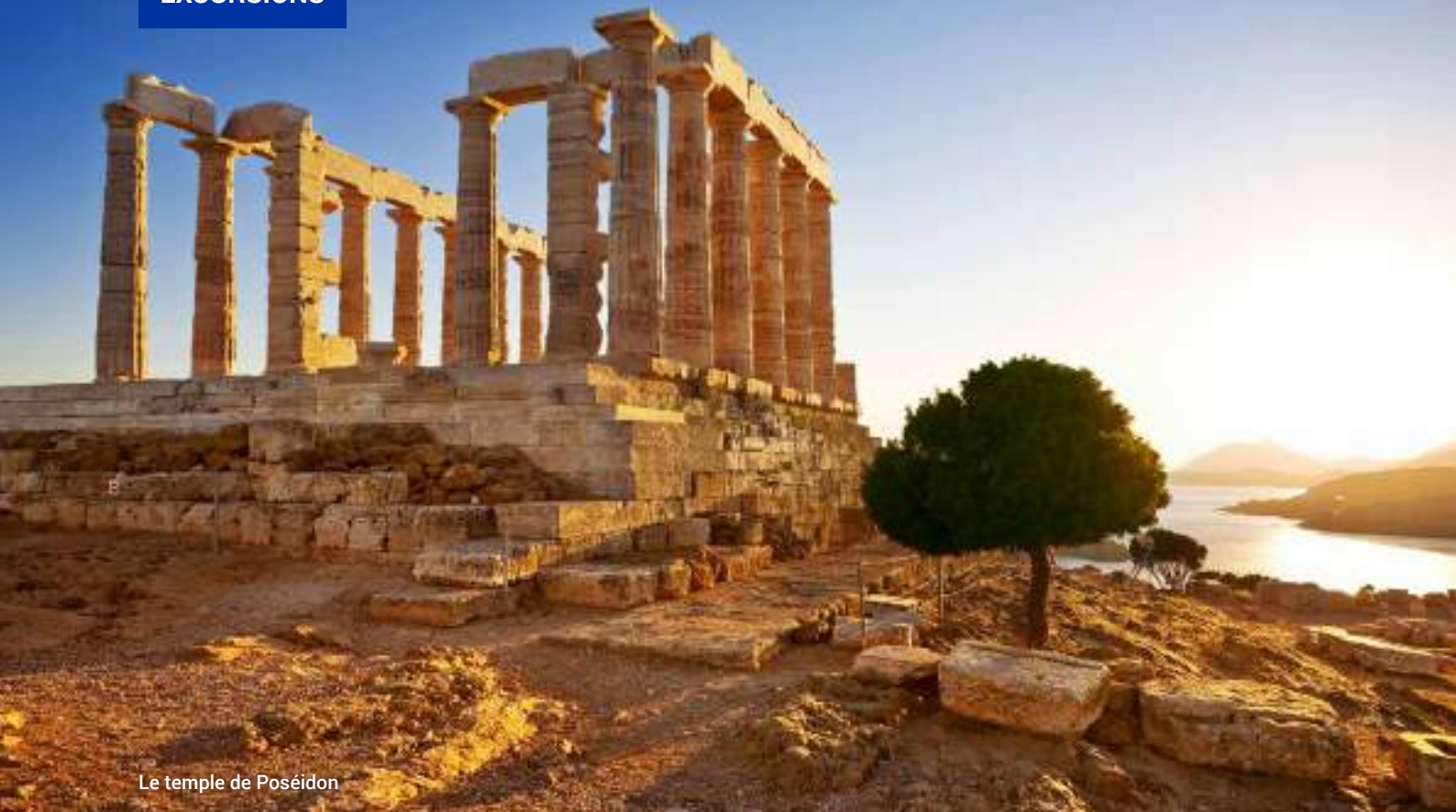
Le temple de Poséidon