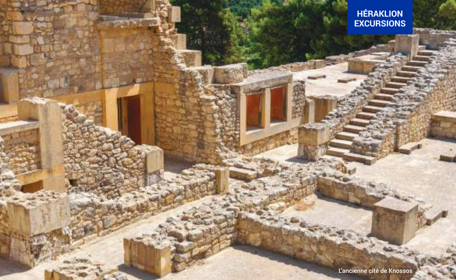
L'ancienne cité de Knossos