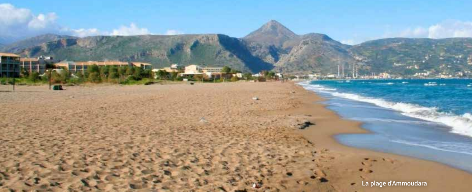
La plage d'Ammoudara