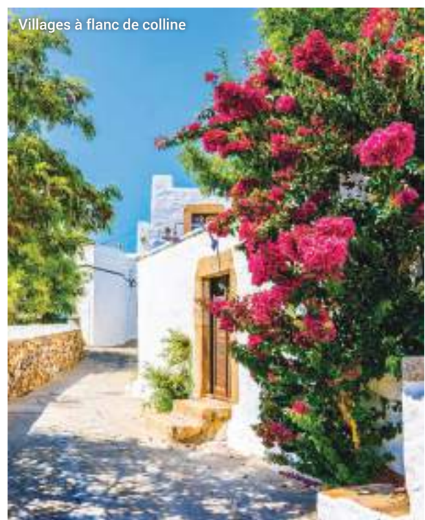
Villages à flanc de colline

Une immersion totale et authentique au cœur de la campagne de Patmos.