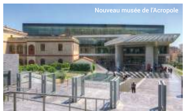
Nouveau musée de l'Acropole