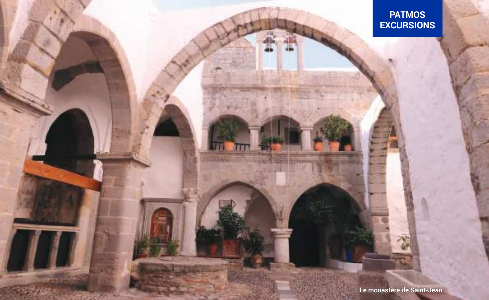
Le monastère de Saint-Jean