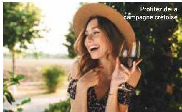
Profitez de la campagne crétoise

principales personnalités historiques et les joyaux de ses magnifiques édifices, notamment la forteresse Koules, la loggia vénitienne, la basilique Saint-Marc, le monastère médiéval de Sainte-Catherine et la cathédrale d'Agios Minas.