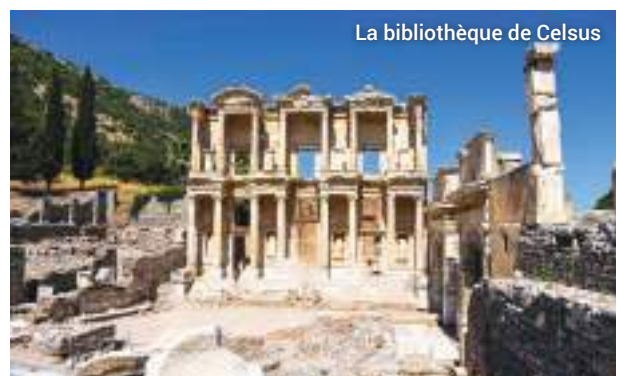
La bibliothèque de Celsus

Nous aurons le temps de faire quelques emplettes, de tapis, bijoux, objets en cuir et autres souvenirs, à la fin de l'excursion.