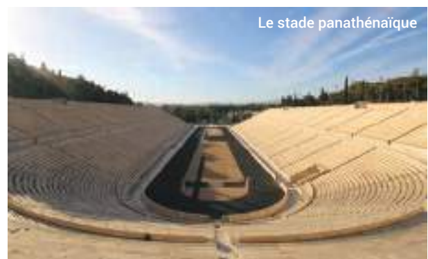
Le stade panathénaïque

Notre odyssée de trois heures à travers l'histoire ancienne se termine par un retour dans le présent, sur les places Omonia et Syntagma, cœur de la ville moderne d'Athènes.