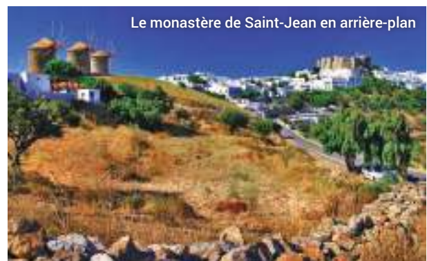
Le monastère de Saint-Jean en arrière-plan

Du café et autres rafraîchissements vous attendent au charmant café d'Arion.