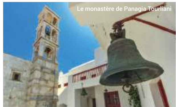
Le monastère de Panagia Tourliani

Il est possible que cette excursion soit indisponible à certaines périodes de l'année.