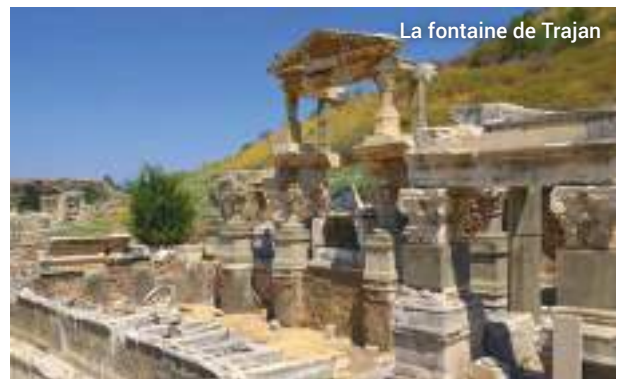
La fontaine de Trajan

Nous aurons le temps de faire quelques emplettes, de tapis, bijoux, objets en cuir et autres souvenirs, à la fin de l'excursion.