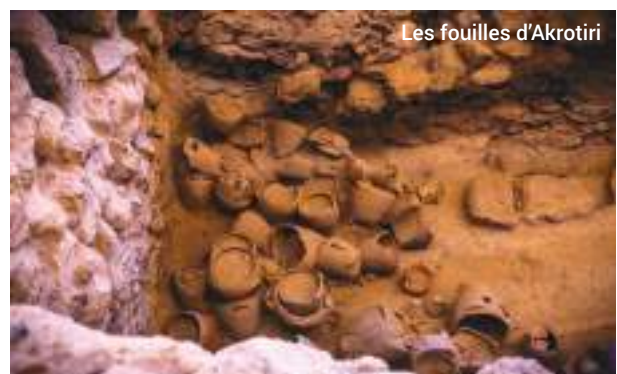
Les fouilles d'Akrotiri

Il est possible que cette excursion soit indisponible à certaines