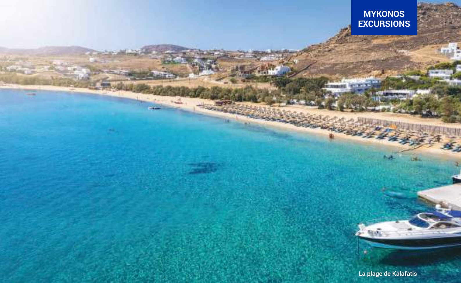
La plage de Kalafatis