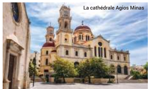
La cathédrale Agios Minas