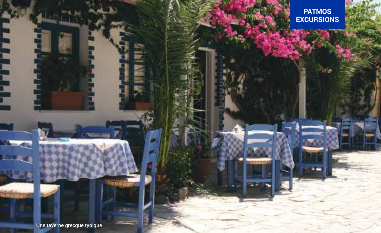
Une taverne grecque typique