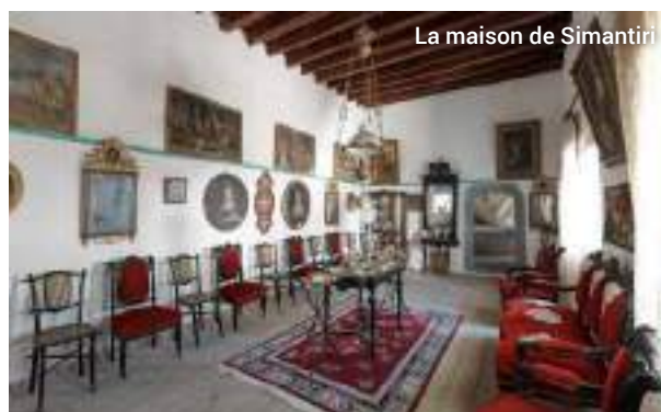
La maison de Simantiri

Les pièces abritent des meubles anciens et des objets en argent de la Russie du 17e siècle, de précieuses œuvres d'art et des icônes des 15e et 17e siècles. Cette demeure est un véritable joyau, mais aussi une machine à remonter le temps, qui intrigue et fascine ses visiteurs.