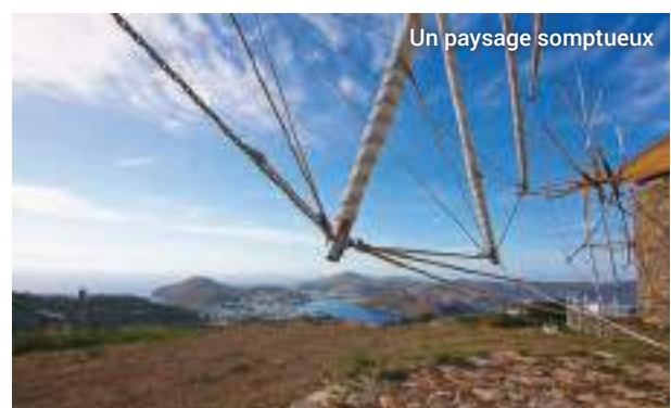
Un paysage somptueux