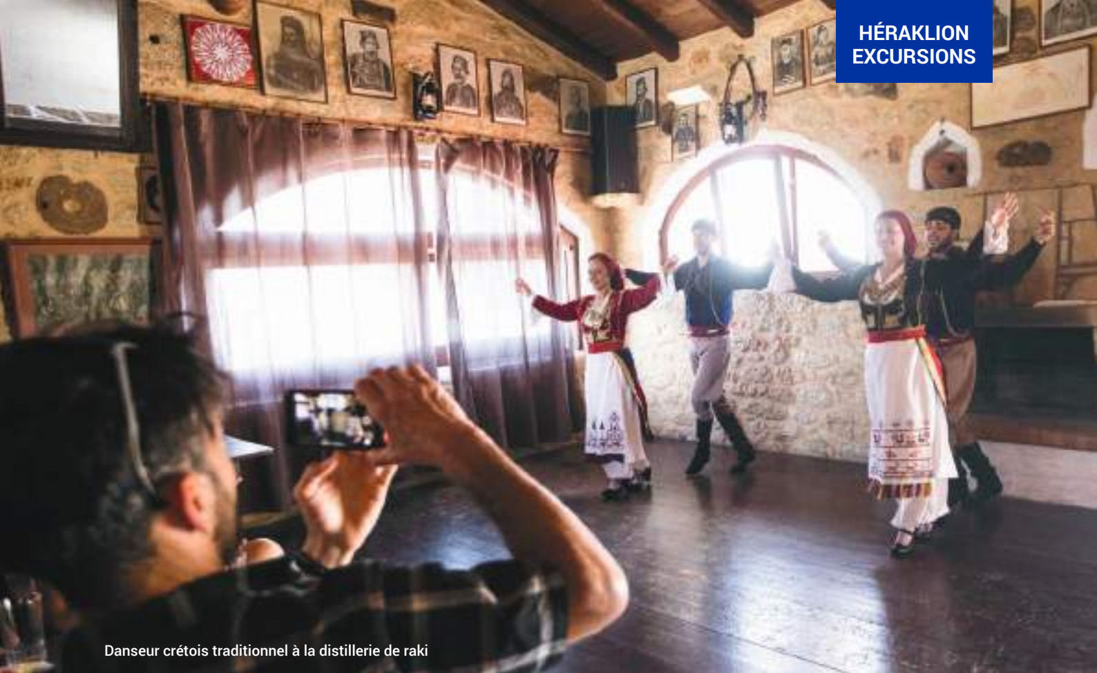
Danseur crétois traditionnel à la distillerie de raki