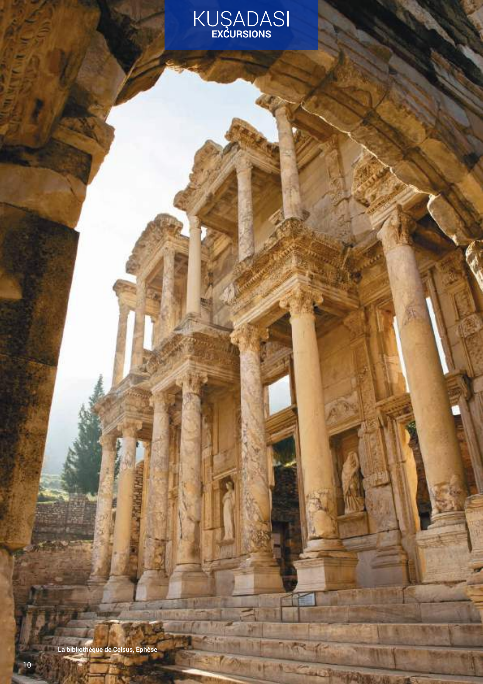
La bibliothèque de Celsus, Éphèse