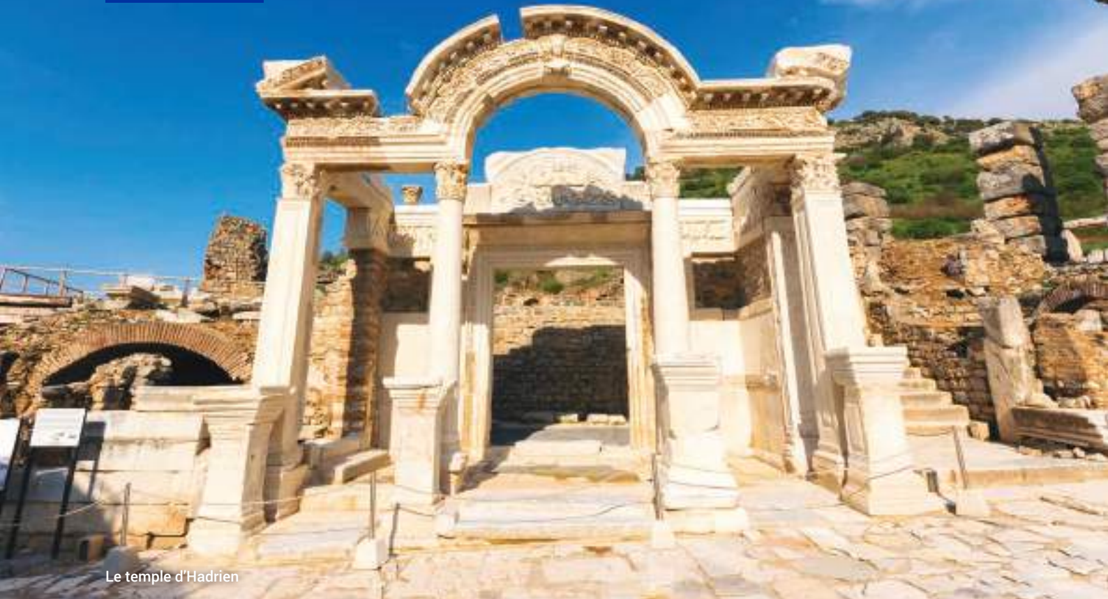
Le temple d'Hadrien