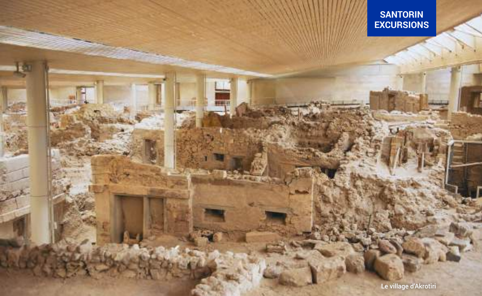
Le village d'Akrotiri