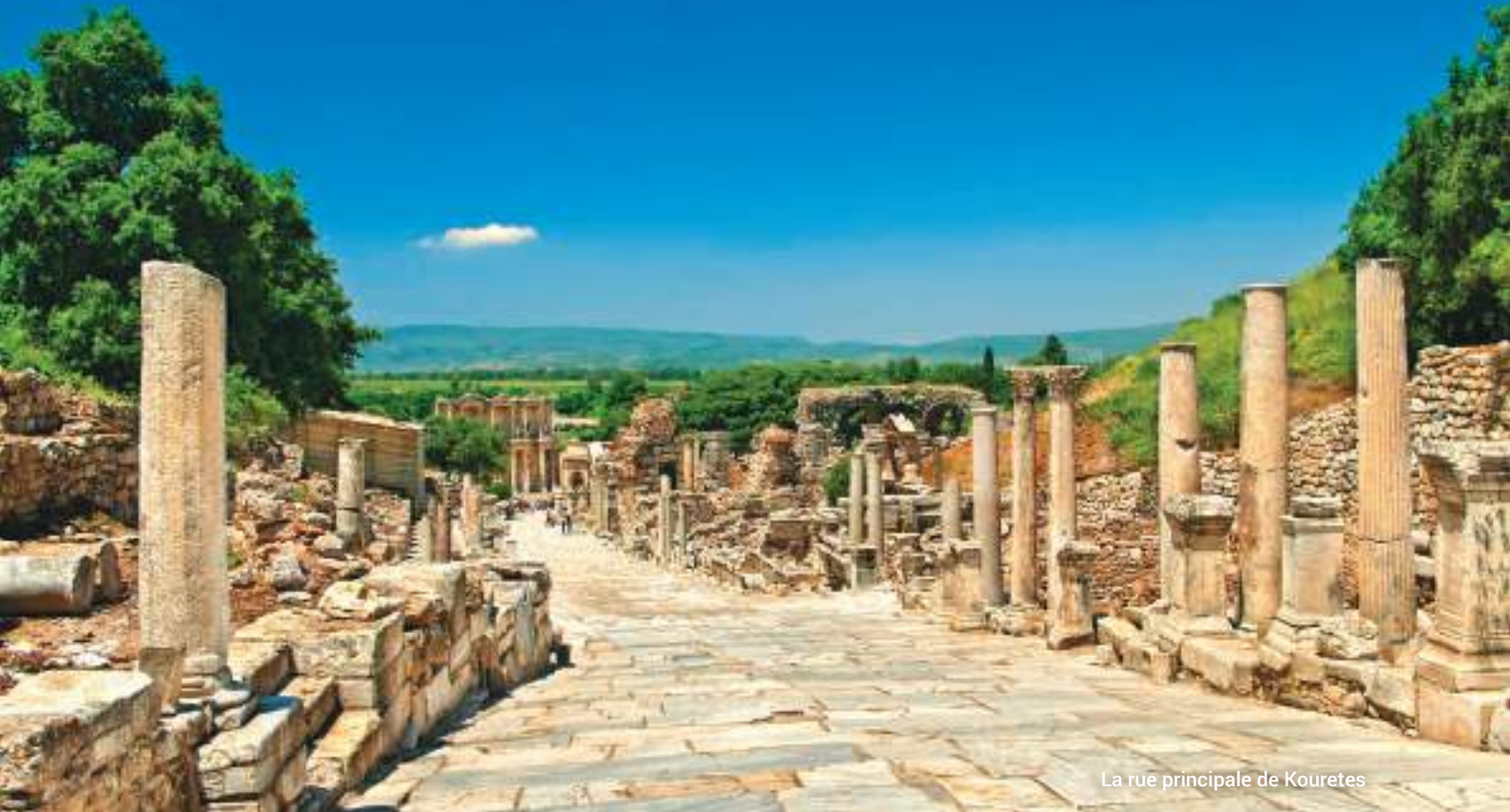
La rue principale de Kourtes