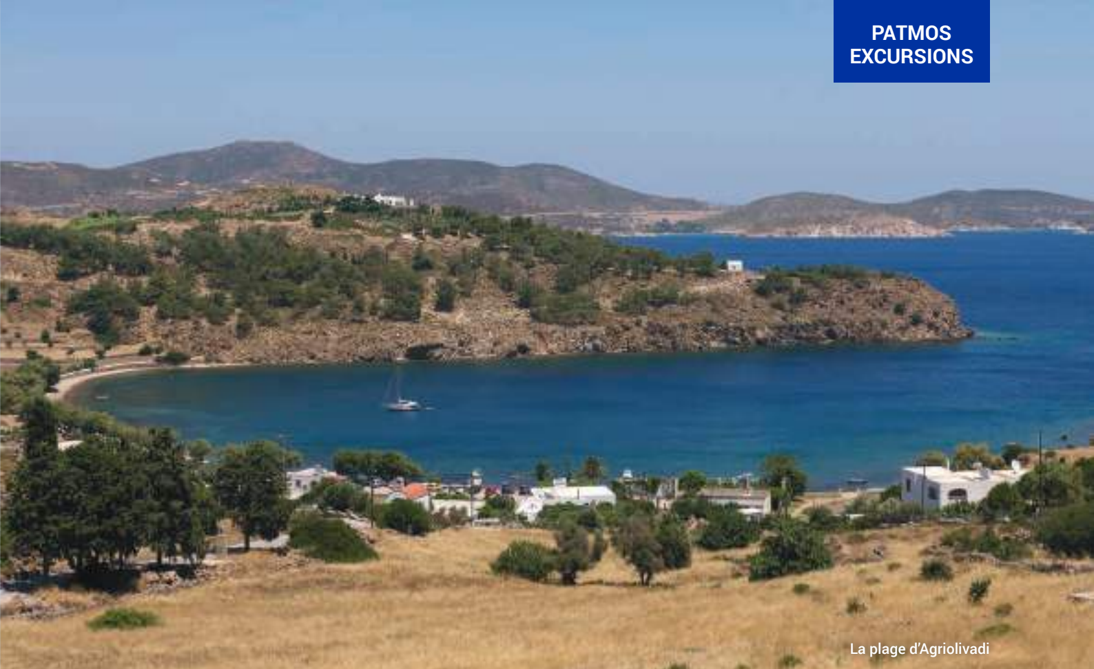
La plage d'Agriolivadi