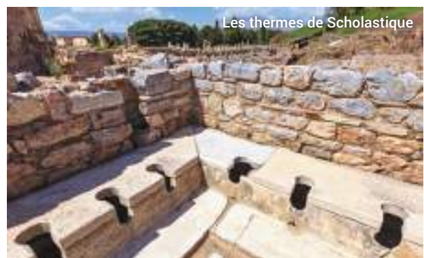
Les thermes de Scholastique