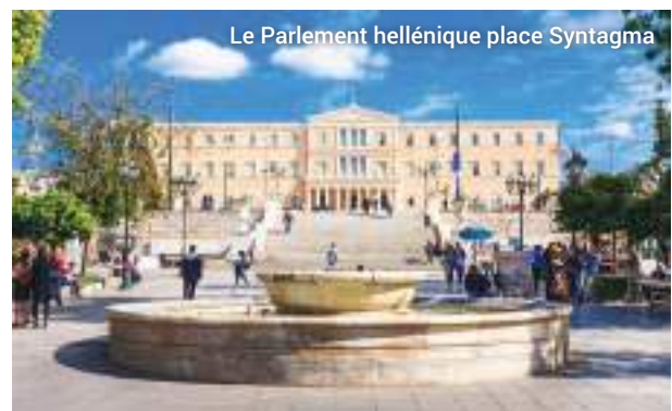
Le Parlement hellénique place Syntagma

A la fin de cette visite, nous espérons que vous aurez apprécié toutes les splendeurs du coeur d'Athènes à leur juste valeur et que vous vous serez fait une belle idée de l'une des capitales historiques les plus importantes du monde.