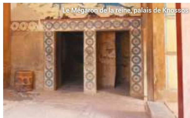
Le Mégaron de la reine, palais de Knossos

Notre excursion s'achève au Musée archéologique d'Héraklion où nous enrichissons nos connaissances sur l'histoire et la culture crétoises.