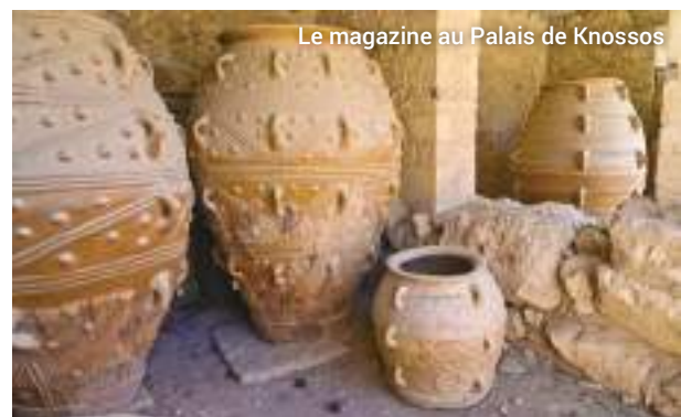
Le magazine au Palais de Knossos

Lors de notre exploration au fil des pièces, nous remonterons le temps dans le Hall de la garde royale et la chambre du Roi, et nous familiariserons avec l'œuvre du roi Minos, un souverain juste.