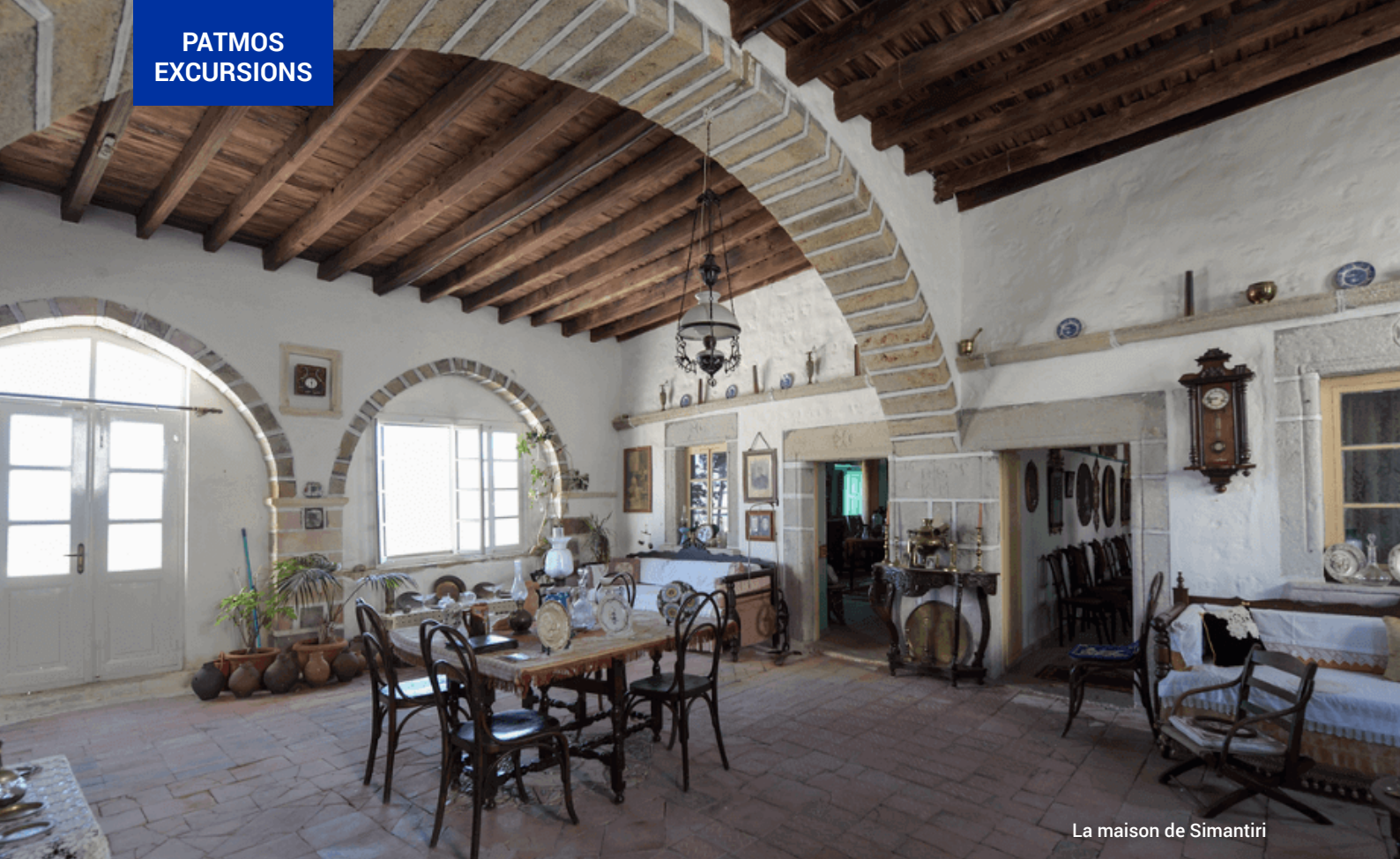
La maison de Simantiri