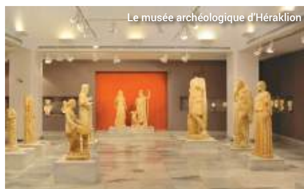
Le musée archéologique d'Héraklion