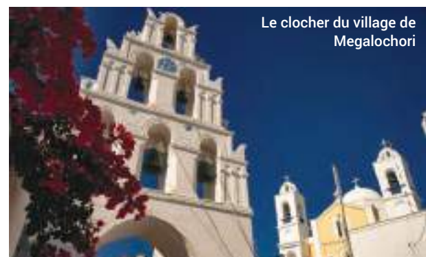
Le clocher du village de Megalochori