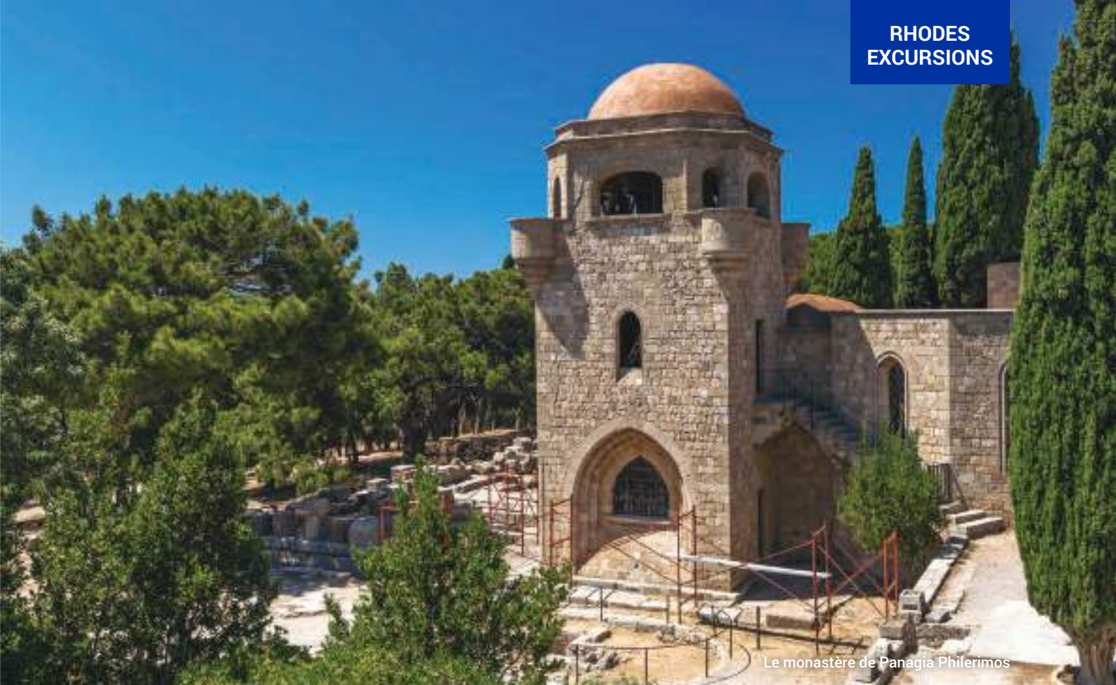
Le monastère de Panagia Philerimos