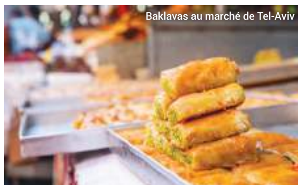
Baklavas au marché de Tel-Aviv

Nous visiterons le marché multicolore du Carmel et nous imprègnerons de l'ambiance qui règne dans cette vibrante métropole.