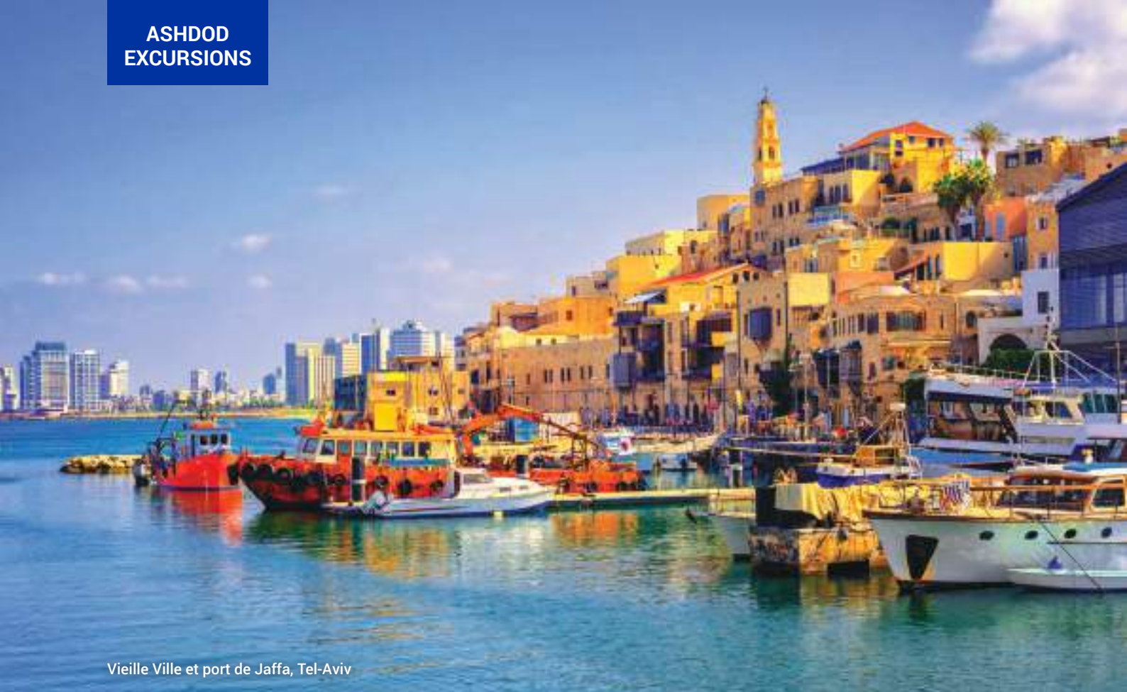
Vieille Ville et port de Jaffa, Tel-Aviv