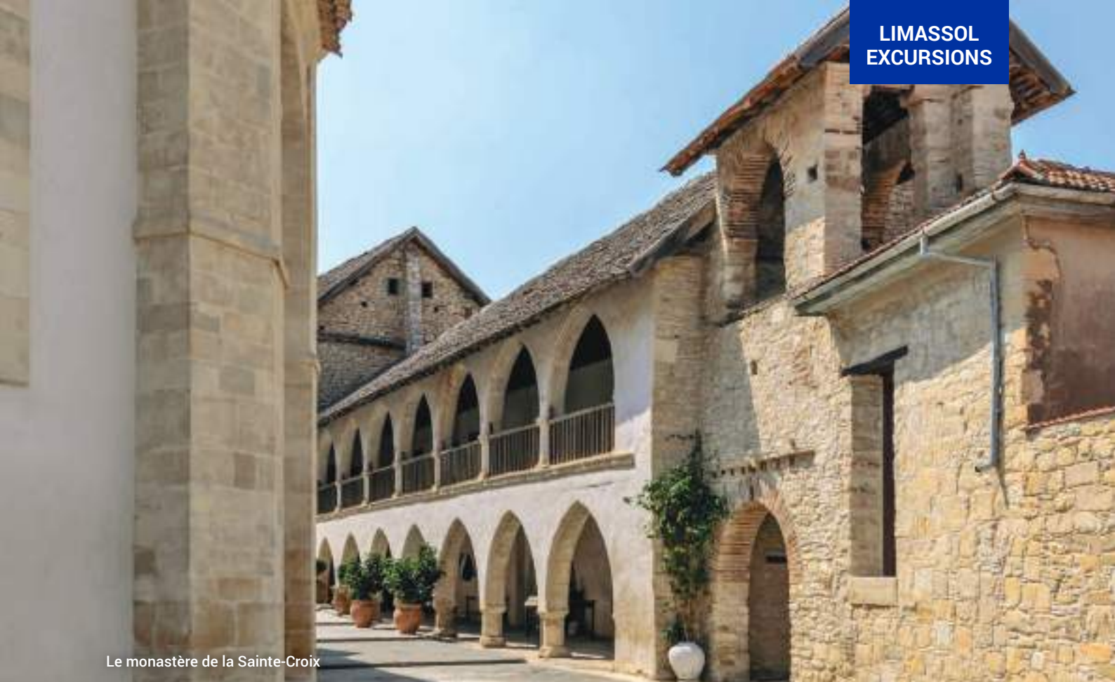
Le monastère de la Sainte-Croix