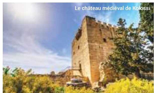
Le château médiéval de Kolossi

Attraction touristique majeure, l'amphithéâtre qui a été minutieusement restauré et accueille souvent des spectacles musicaux ou pièces de théâtre.