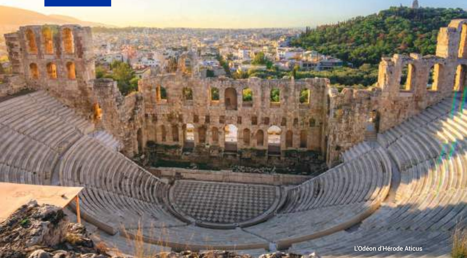
L'Odeon d'Hérode Atticus