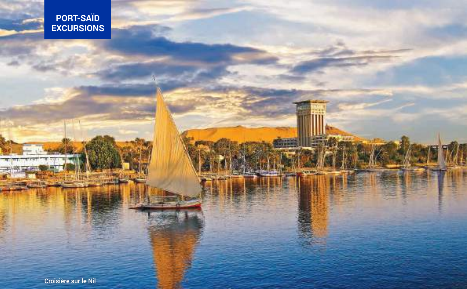
Croisière sur le Nil