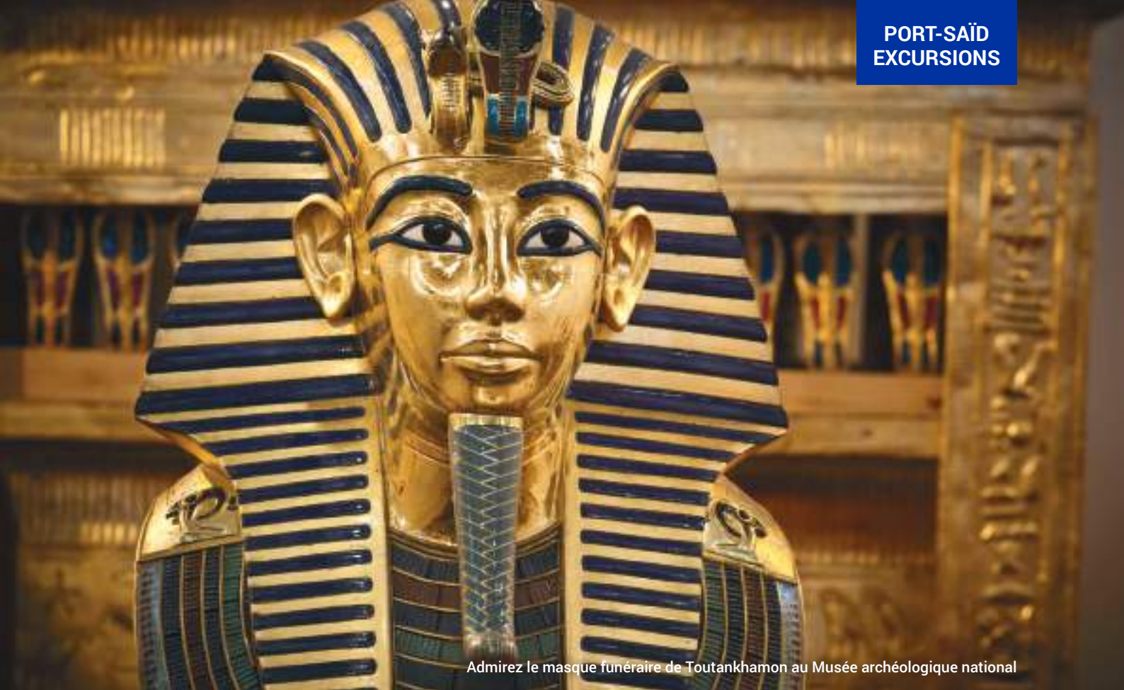
Admirez le masque funéraire de Toutankhamon au Musée archéologique national