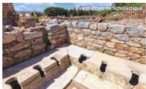
Les thermes de Scholastique