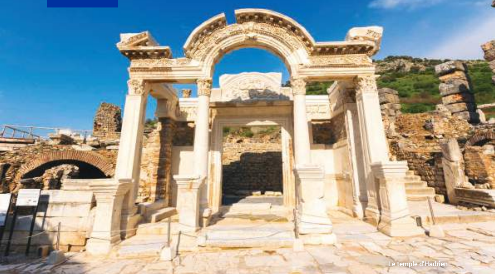
Le temple d'Hadrien