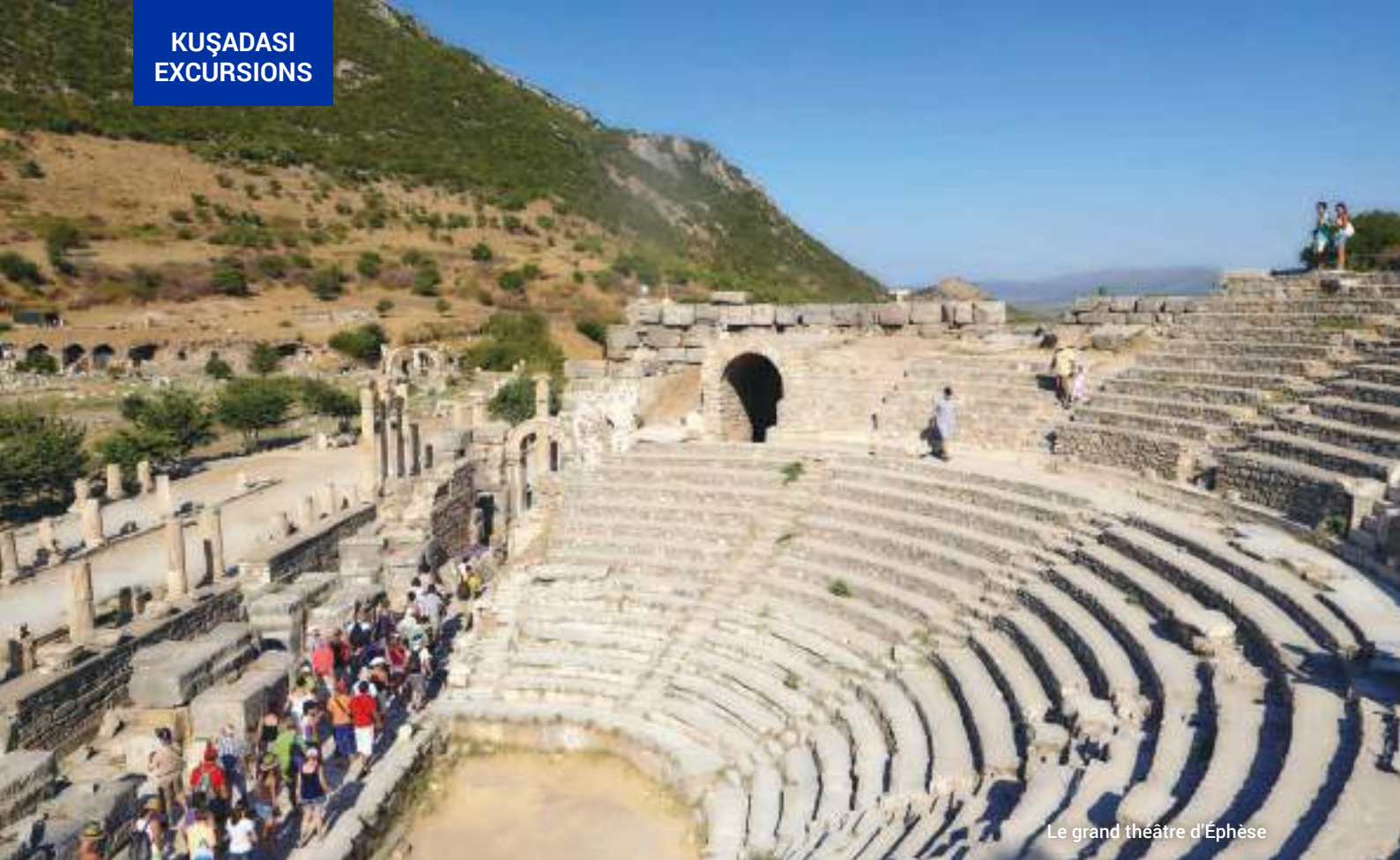
Le grand théâtre d'Éphèse