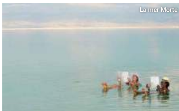
La mer Morte

Pause pour une baignade dans la mer Morte. Vous pouvez faire la planche sans couler en lisant votre journal !