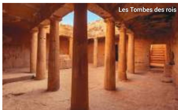
Les Tombes des rois

C'est ici, selon la mythologie grecque, que naquit la déesse de la beauté et de l'amour. C'est l'un des endroits les plus photographiés et énigmatiques de Chypre, préparez votre appareil-photo ou votre smartphone !