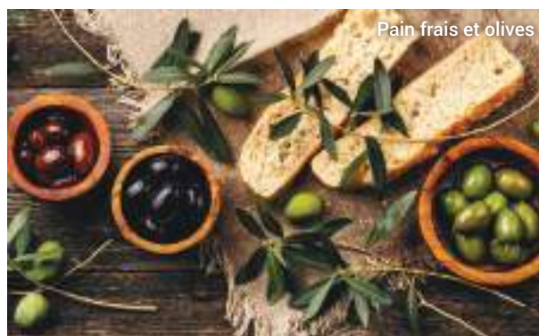
Pain frais et olives

Enfin, nous regagnerons le navire en autocar, à travers Limassol et le long de la côte.