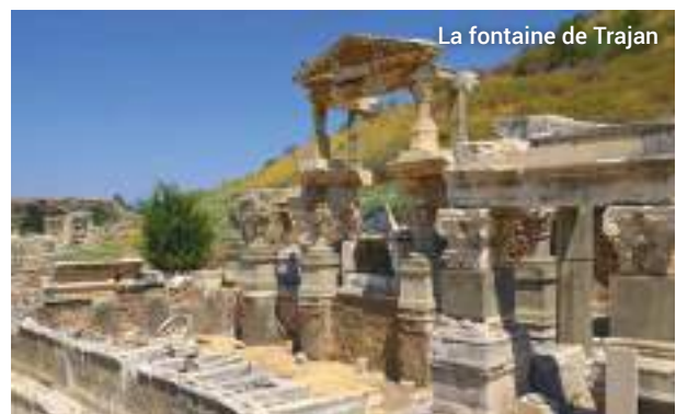
La fontaine de Trajan

Nous aurons le temps de faire quelques emplettes, de tapis, bijoux, objets en cuir et autres souvenirs, à la fin de l'excursion.