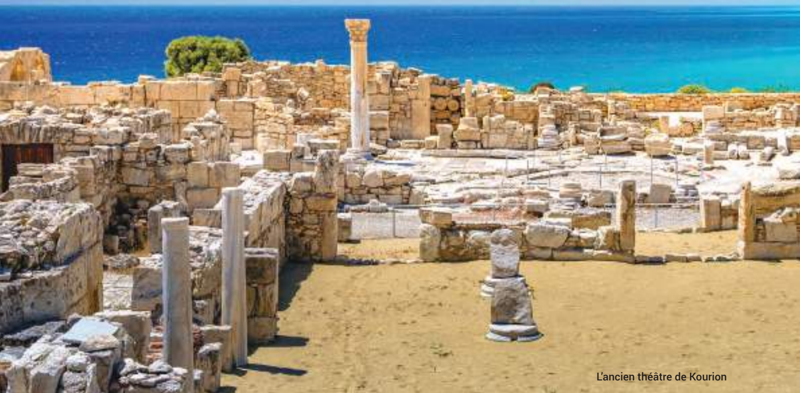
L'ancien théâtre de Kourion