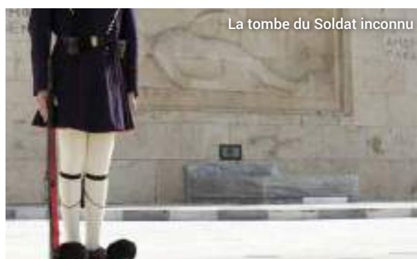
La tombe du Soldat inconnu