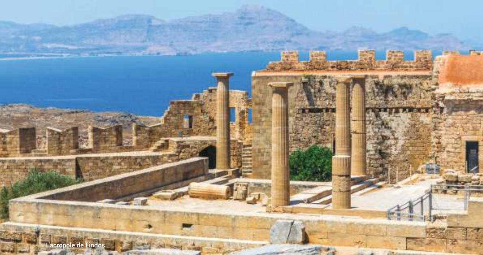
L'acropole de Lindos