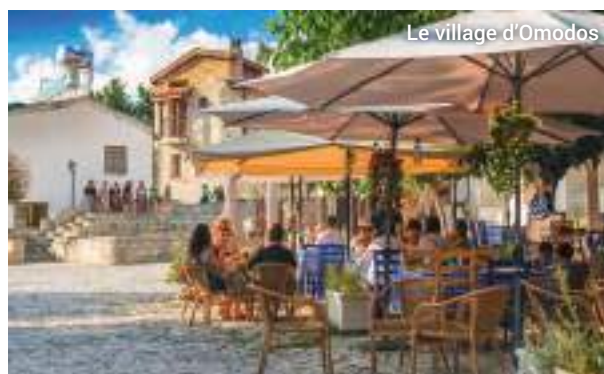
Le village d'Omodos