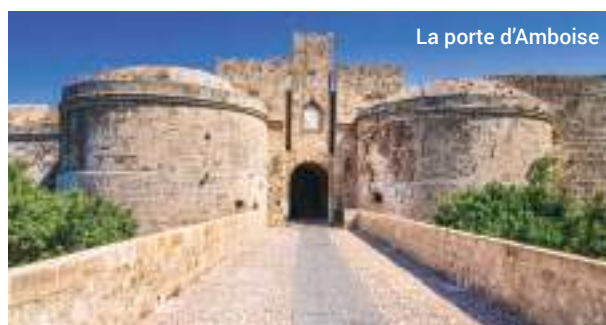
La porte d'Amboise

Quoi qu'il en soit, cette excursion nous transporte au cœur de la fascinante histoire de Rhodes.