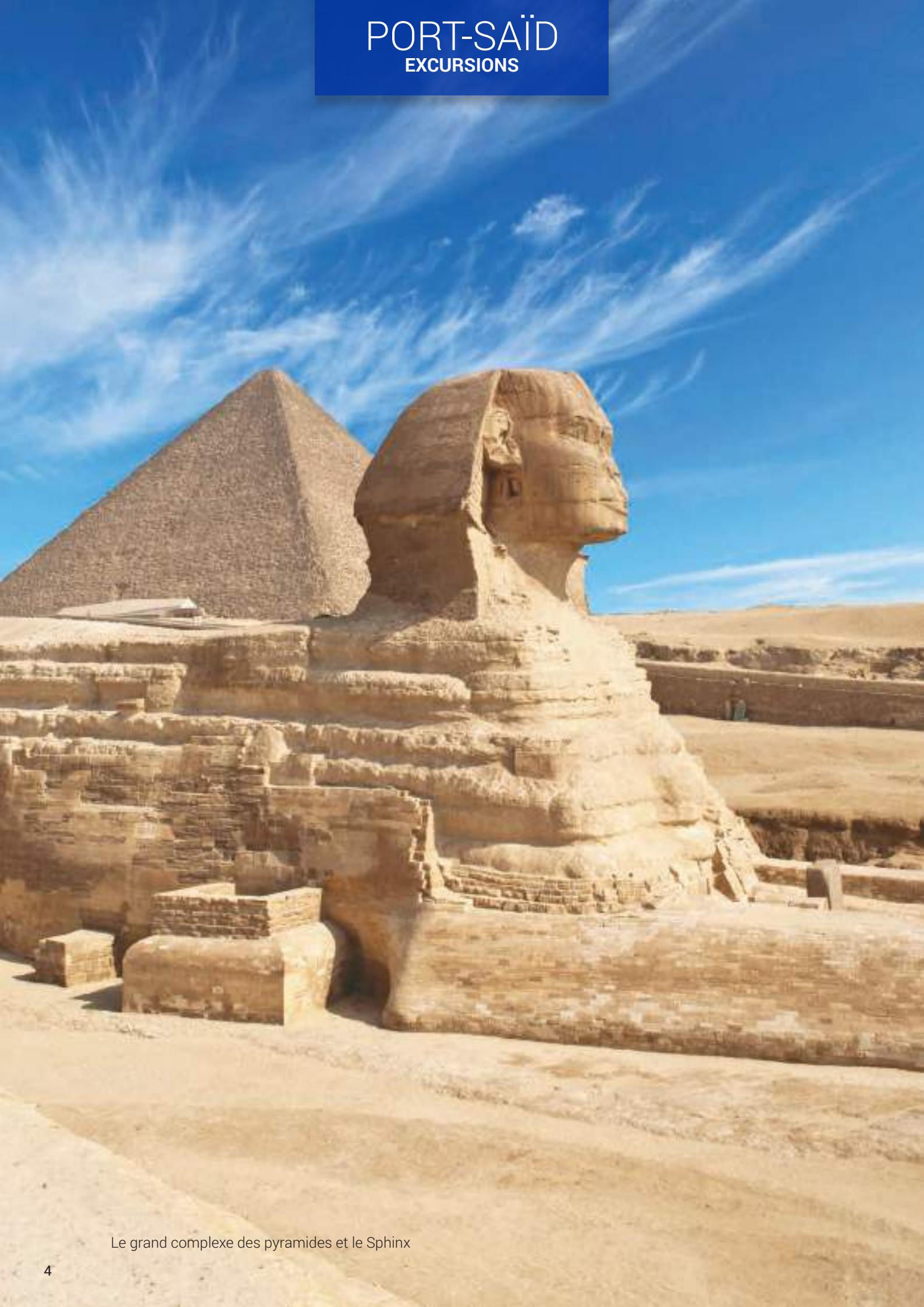
Le grand complexe des pyramides et le Sphinx