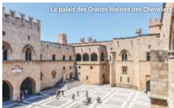
Le palais des Grands Maîtres des Chevaliers

Notre excursion comprend également la Mosquée de Soliman le Magnifique, les bains turcs, l'Hôpital des Chevaliers et Notre-Dame-du-Château, qui veille sur la ville depuis le 11e siècle.