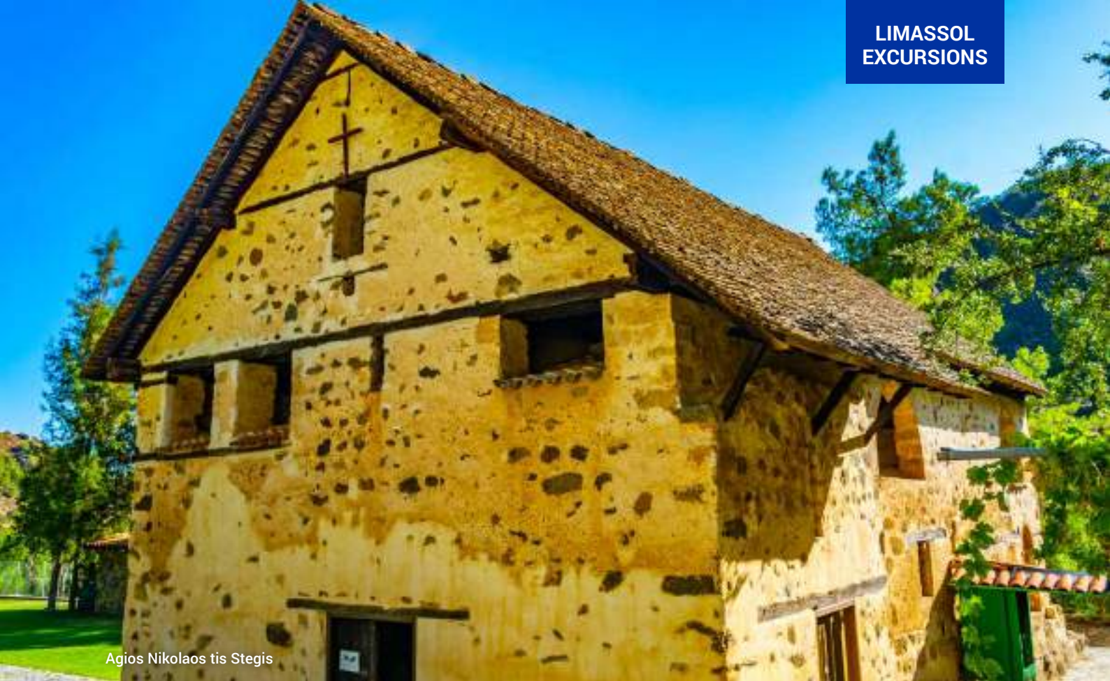
Agios Nikolaos tis Stegis