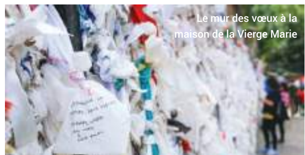
Le mur des vœux à la maison de la Vierge Marie

Éphèse est l'un des plus vastes, fascinants et inspirants musées archéologiques de plein air au monde. Vous n'êtes pas près d'oublier cette excursion.