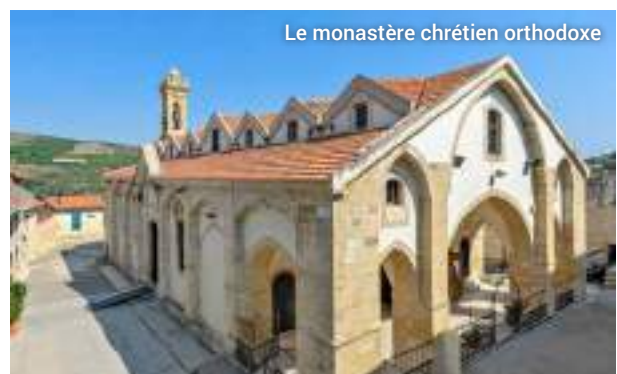
Le monastère chrétien orthodoxe

Les amateurs de vin passeront quelques heures absolument fascinantes et exceptionnelles. Chacun y trouvera l'occasion de se ressourcer, dans la sérénité du Troodos.