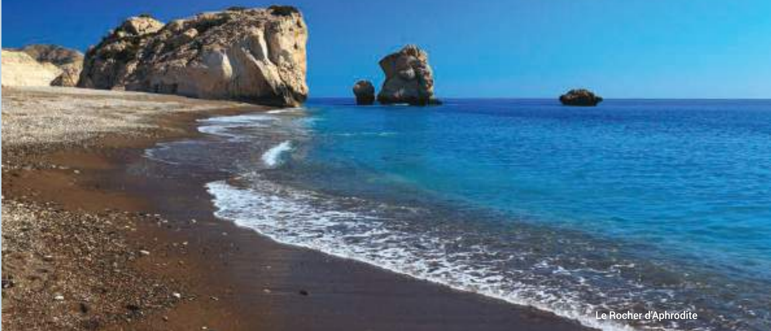
Le Rocher d'Aphrodite