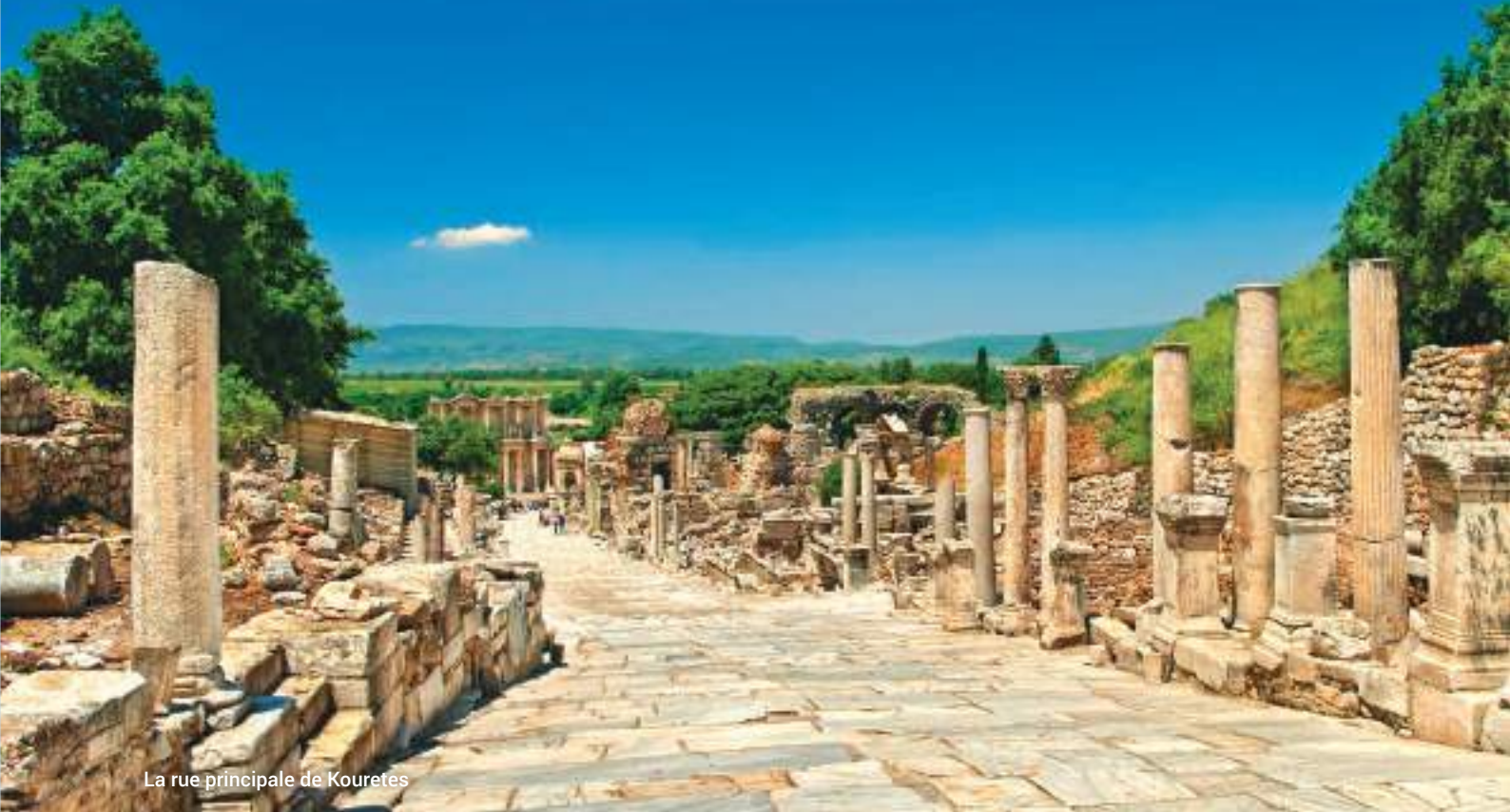
La rue principale de Kouretes