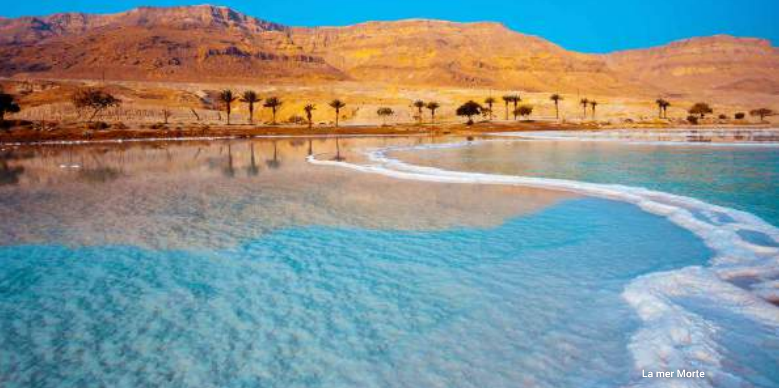
La mer Morte