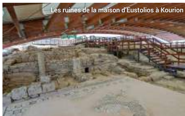
Les ruines de la maison d'Eustolios à Kourion

Après le déjeuner, nous visiterons le monastère de la Sainte-Croix et son pressoir à vin médiéval. Nous dégusterons des vins dans la cave d'un villageois avant de regagner le port où nous attend notre navire, en traversant la ville colorée de Limassol.