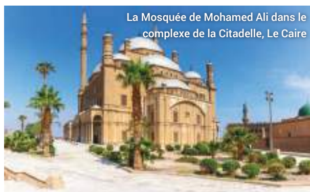
La Mosquée de Mohamed Ali dans le complexe de la Citadelle, Le Caire

Nous jetons l'ancre et rejoignons la Citadelle de Saladin et la Mosquée d'Albâtre de Mohamed Ali dont nous admirerons les intérieurs exquis et l'horizon fascinant de la vieille ville du Caire depuis le sommet de la colline. Nous faisons notre dernier arrêt à l'Institut du papyrus pour découvrir l'art ancestral consistant à transformer des roseaux en papier avant de faire quelques emplettes, pour enfin regagner notre navire à Port Saïd.