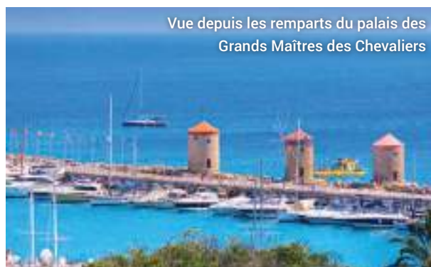
Vue depuis les remparts du palais des Grands Maîtres des Chevaliers