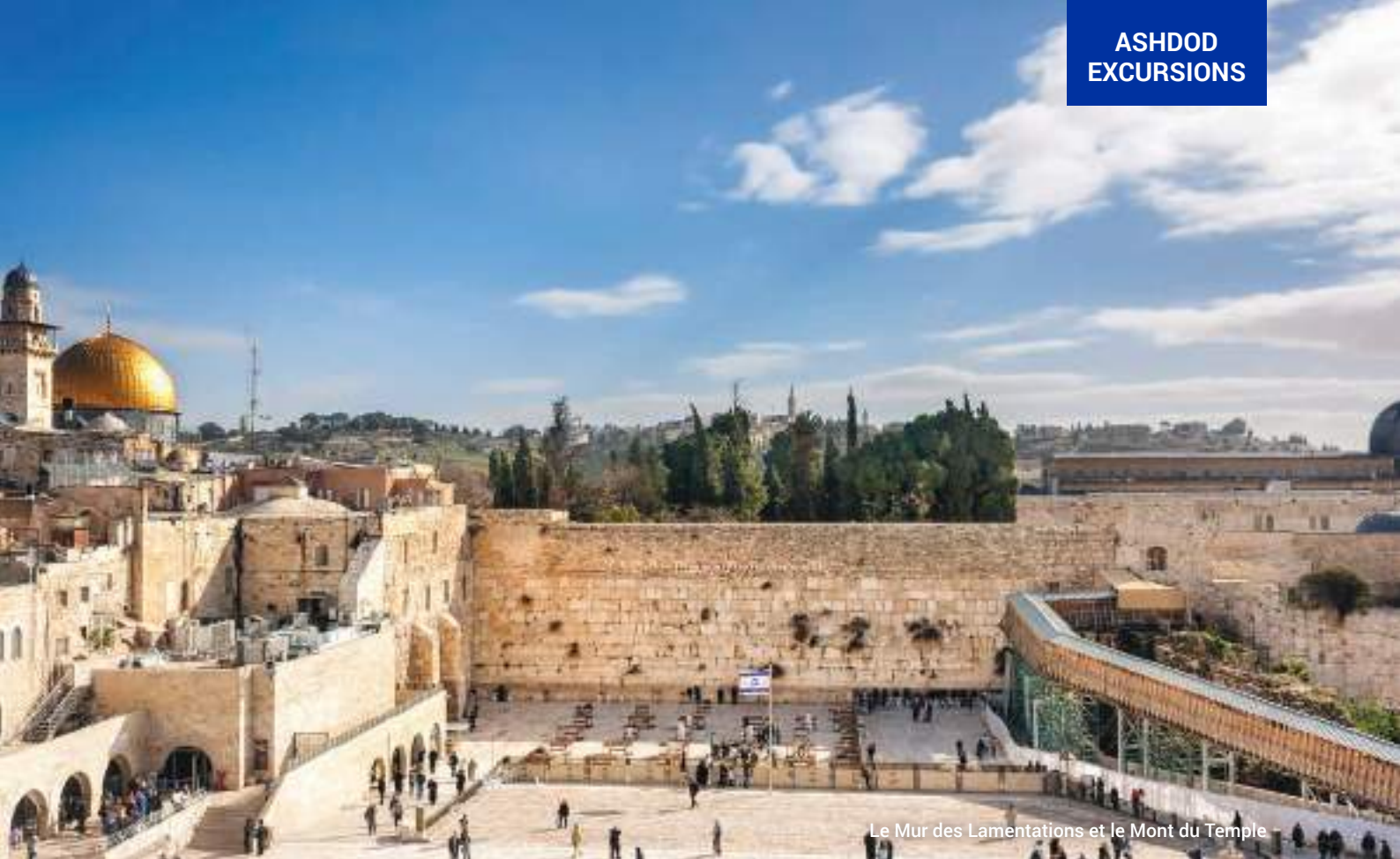
Le Mur des Lamentations et le Mont du Temple