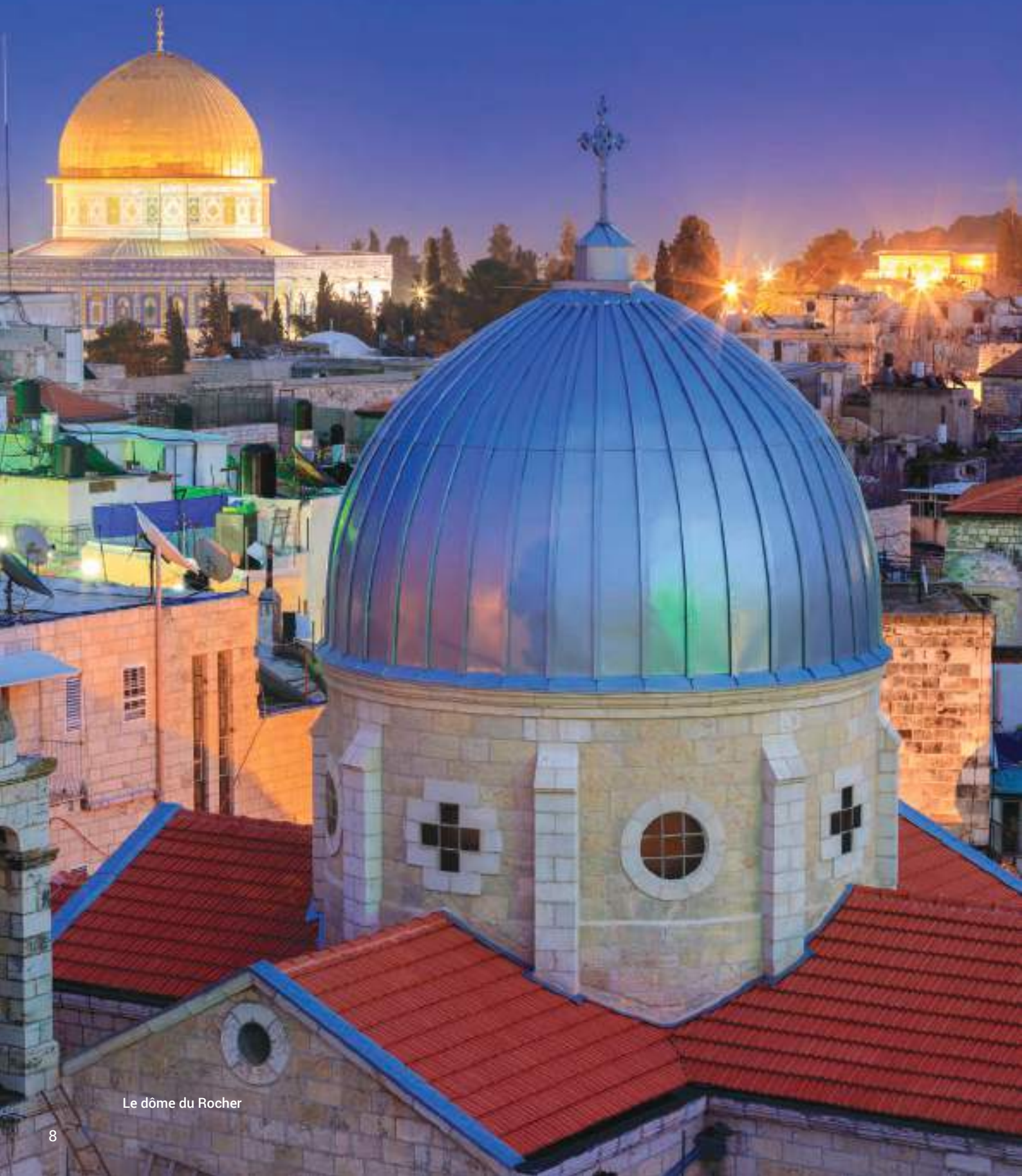
Le dôme du Rocher