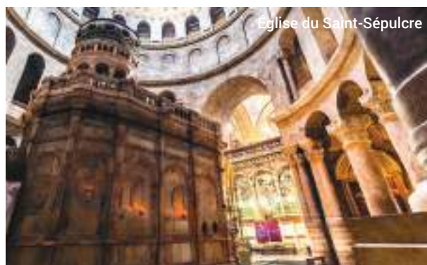
Église du Saint-Sépulcre

Nous nous rendrons alors à Bethléem, sur la rive occidentale, afin de visiter le lieu de naissance de Jésus, l'église de la Nativité et la place de la Mangeoire. Vous déjeunerez à Bethléem, où vous aurez le temps de dénicher quelques souvenirs avant de regagner le port.