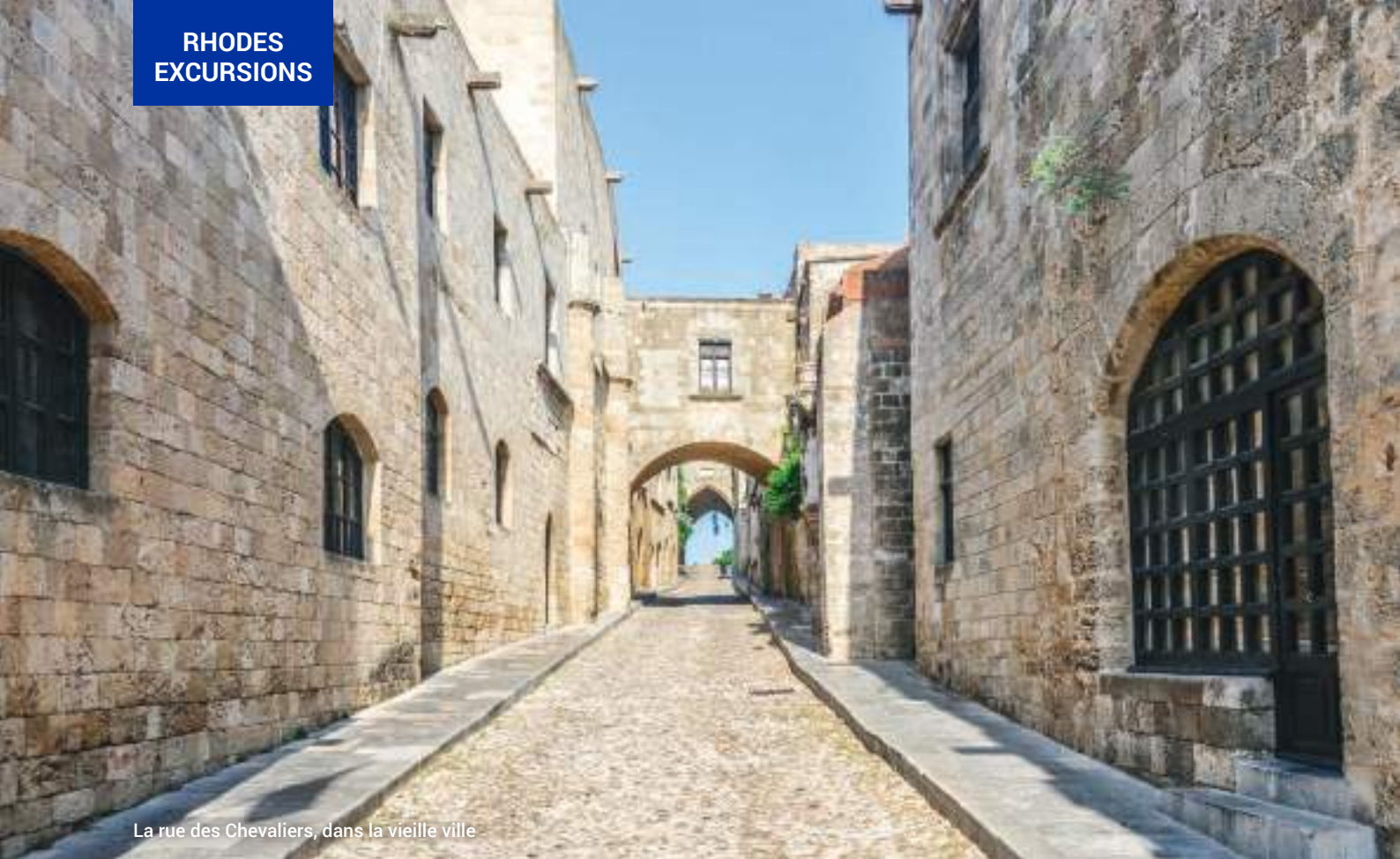
La rue des Chevaliers, dans la vieille ville