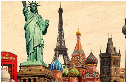
Affoltern im Emmental