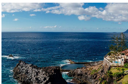
Puerto de Santiago - los Gigantes