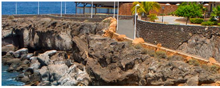
Playa de los Cristianos